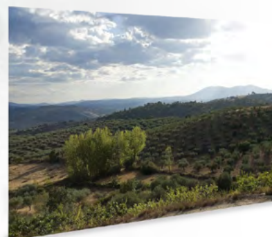
La Reserva de la Biosfera Transfronteriza Meseta Ibérica (RBT)