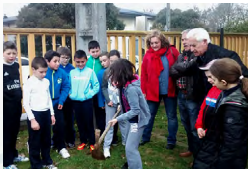
CEIP de Meira (Reserva de la Biosfera Terras do Miño)

En esta ocasión, el árbol escogido fue el acebo, una especie típica de las zonas montañosas del centro e interior de Galicia que forma parte de la lista de especies protegidas. A través de este tipo de iniciativas, ambas Reservas de la Biosfera fomentan la concienciación medioambiental en todas las edades, enseñando valores encaminados a mantener y preservar los recursos naturales y a aprender su importancia para la riqueza de las reservas.