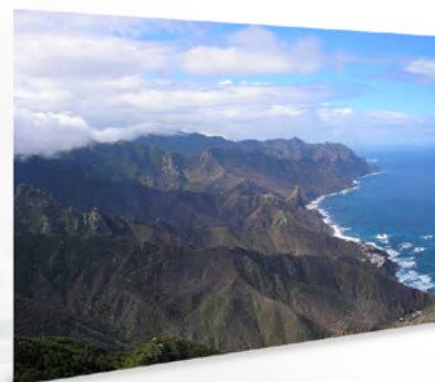
La Reserva de la Biosfera del Macizo de Anaga

La declaración de la RB Transfronteriza de la Meseta Ibérica contribuirá al desarrollo sostenible del territorio transfronterizo que la constituye, la preservación de sus valores naturales y culturales y el fomento de la cohesión territorial.