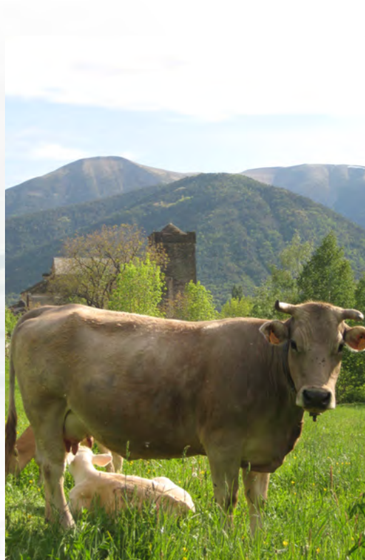
Raza autóctona certificada

Todos los asistentes se mostraron muy ilusionados por la propuesta y creen que puede suponer un importante impulso para el desarrollo socioeconómico de esta zona, puesto que los valores que representa la Reserva son compartidos por todos ellos y por un número cada vez mayor de visitantes que demandan un aprovechamiento y disfrute de los recursos y productos de este territorio, donde los intereses del hombre y la naturaleza deben desarrollarse de forma armónica y sostenible.