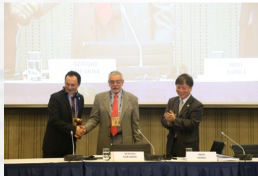
Cambio de Presidencia del CIC

En esta sesión del CIC se adoptó el nuevo Plan de Acción de Lima para el Programa MAB y la Red Mundial de Reservas de la Biosfera, que tendrá una vigencia de 10 años, y que se ha elaborado durante los meses previos al IV Congreso Mundial de Reservas de la Biosfera y acordado en dicho evento. Además, se realizó el seguimiento de las acciones que se llevan a cabo en la aplicación de la Estrategia de Salida de las reservas de la biosfera que no consiguen adaptarse al cumplimiento de los requisitos exigidos.