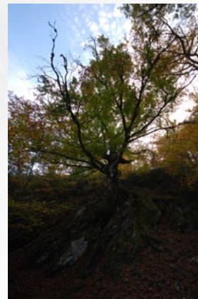
Autor: MANIMAL, S. L.

la dinámica forestal del Hayedo desde 1961 ha demostrado que las hayas centenarios con mayor presencia de masa subyacente han reducido su crecimiento en los últimos 25 años un 40% respecto de las situadas en parcelas con menor densidad. Los pies de mayores dimensiones de esta masa instalada también disminuyeron sensiblemente su crecimiento.