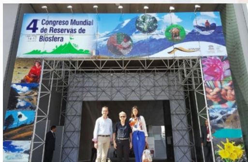
Asistencia del Vice-Presidente de la Diputación de Zamora, la Presidenta de la AECT ZASNE y la Directora de la AECT ZASNET y Gestora de la RB

Los expertos participantes en el congreso han analizado las experiencias aprendidas y los retos que tendrá que afrontar en el futuro la Red Mundial de Reservas de Biosfera, con nuevo plan de acción de Lima 2016-2025.