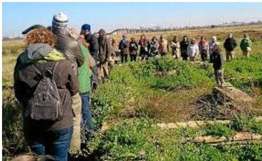
Visita a la ciudad islámica de Saltés