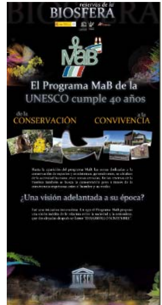
Panel primero vertical

http://www.marm.es/es/ceneam/exposiciones-del-ceneam/exposiciones-itinerantes/rerb.aspx , desde donde también se puede solicitar el préstamo y acceder a otras formas de uso, siguiendo los protocolos establecidos para ello. También se pueden descargar los carteles para impresión en DIN A3.