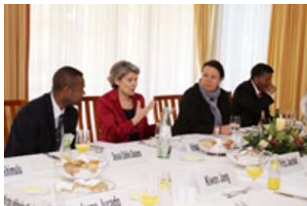
DG Unesco en la Conferencia 2011