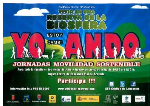
Cartel anunciador de las Jornadas de Movilidad Sostenible

Un ejemplo de esas buenas prácticas son las Jornadas sobre Movilidad Sostenible que se han desarrollado durante los meses de julio y agosto.