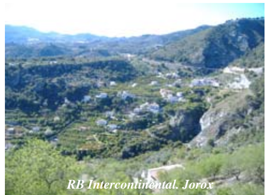
RB Intercontinental. Jorox

El acuerdo estará vigente durante cinco años. Durante este periodo se crearán órganos de coordinación transfronteriza para la consolidación de la reserva, y se elaborarán herramientas de gestión para la aplicación de los planes en los espacios integrados en la reserva.