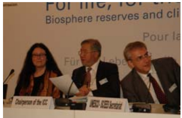
Mesa del CIC

El CIC tiene entre sus funciones la denominación de nuevas reservas de la biosfera. En esta ocasión se presentaron 20 nuevas propuestas y fueron aceptadas 18, ninguna originada en España. Por otra parte, una reserva fue retirada de la Red a petición del país interesado, Austria. Tras estos cambios, la Red Mundial de Reservas de la Biosfera pasa de 563 a 580 reservas.