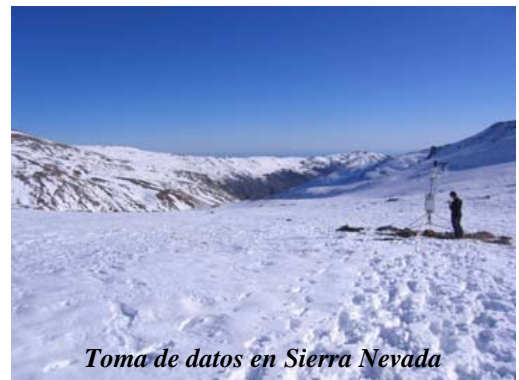
Toma de datos en Sierra Nevada

La UNESCO ha analizado el trabajo desarrollado por 564 reservas de la biosfera en materia de investigación, adaptación y mitigación de los efectos del cambio climático en el horizonte 2008-2013. En este sentido, ha destacado la labor desarrollada en este enclave andaluz a través del Observatorio de Cambio Global de Sierra Nevada que contiene un exhaustivo programa de seguimiento y numerosos