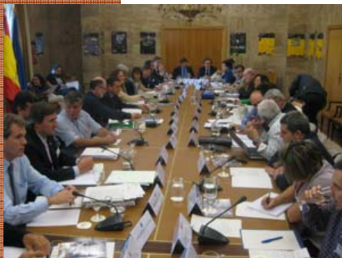
Reunión Comité MaB, 3 octubre 2011

Las cuatro nuevas propuestas han recorrido un largo camino de procesos de participación para la definición de sus límites, preparación de la documentación requerida, revisión por el Consejo Científico como órgano asesor del Comité MaB, y decisión del Comité MaB en cuanto a presentar las nuevas propuestas ante la UNESCO. En el ámbito nacional, aún les