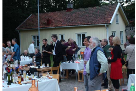
EuroMaB 2011. Compartiendo los productos de las reservas

EuroMaB mantuvo su reunión bianual este año, entre el 4 y el 8 de julio, en Lundsbrunn, Suecia. El lema de la reunión fue "Compartir Futuros Sostenibles". El encuentro de 2011 reunió a 160 personas de 28 Países, en la Reserva de la Biosfera Lake Vannern Archipelago and Mount Kinnekulle (Suecia) y se acordó que la próxima reunión se celebrará en Quebec en 2013.