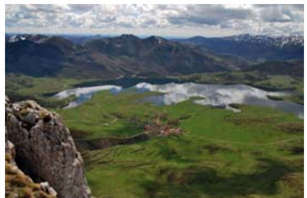
Embalse de Casares. RB Alto Bernesga

Este proyecto se ha desarrollado a través del Convenio firmado con el Ministerio de Medio Ambiente y Rural y Marino dentro del marco del Plan de Acción de la Reserva de la Biosfera Alto Bernesga el cual estará disponible a partir del mes de octubre en formato digital y papel.