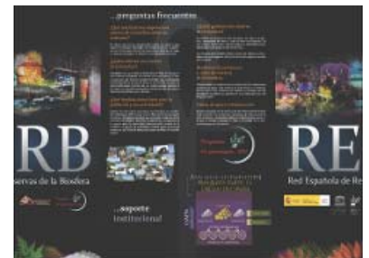
Folleto sobre la Red de Reservas de la Biosfera

Aprovechando el mismo diseño empleado en la exposición citada arriba se ha reeditado un folleto sobre la Red Española de Reservas de la Biosfera, de tamaño DIN A3, plegado a DIN A4 con las solapas enfrentada en el centro de la página. Contiene una información básica sobre el concepto reserva de la biosfera, la Red Española y algunas preguntas frecuentes sobre esta figura.