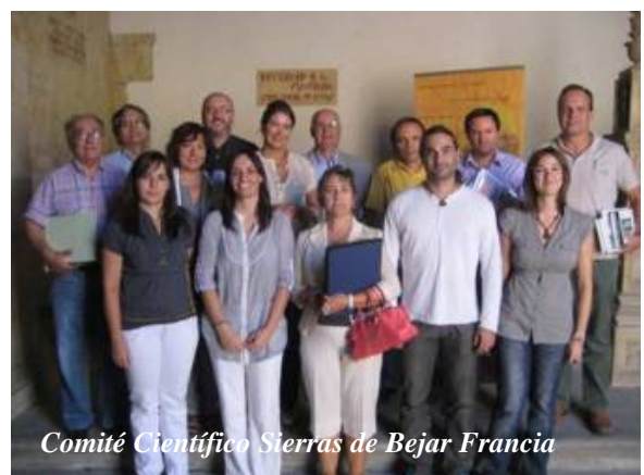
Comité Científico Sierras de Béjar Francia

Este Comité Científico será el encargado de definir las actuaciones en investigación más adecuadas en la Reserva de la Biosfera, buscar financiación para llevarlas a cabo, ponerlas en práctica y hacer un seguimiento de las mismas. Está constituido por 11 miembros, procedentes de la Universidad de Salamanca, la Universidad Autónoma de Madrid, CSIC, Universidad de Extremadura y la Cátedra UNESCO "desarrollo sostenible y medio ambiente" de la Facultad de Biología de la Universidad de Salamanca. Los integrantes son representativos de disciplinas como la biología, educación, geología, geografía, derecho, sociología, ingeniería forestal, economía y antropología.