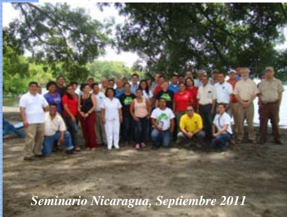
Seminario Nicaragua, Septiembre 2011

En esta ocasión se presentaron varias ponencias por parte de los autores del libro, sobre gestión territorial en reservas de biosfera de ambientes urbanos (Brasil), recomposición del paisaje y reforestación (Paraguay), monitoreo de la productividad primaria (España) e implicancias del turismo en la conservación y el desarrollo local (Chile).