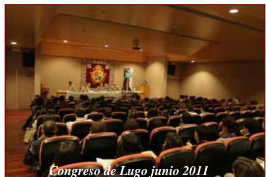
Congreso de Lugo junio 2011