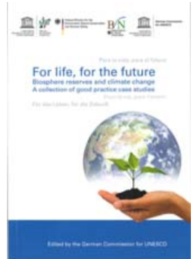
Portada libro Conferencia RB y Cambio Climático. Dresde 2011

http://www.mab40-conference.org/index.php?id=360&tx_ttnews%5Btt_news%5D=69&cHash=40bca6fa304f0f20d45046e3857c6f94