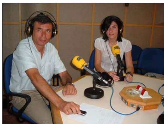
Entrevista de radio

El mensaje va dirigido a toda la población local para que adquiera conciencia del verdadero privilegio de contar con una Reserva de Biosfera a pocos pasos y así visualizar la importancia y las oportunidades que ofrece la vinculación a un espacio con enormes ventajas ecológicas y socioeconómicas, sabiendo aprovechar la singularidad de sus recursos naturales y culturales, así como una marca de calidad ambiental desde el punto de vista turístico con la Reserva de la Biosfera Marismas del Odiel como principal referente de las cuatro localidades que engloba.