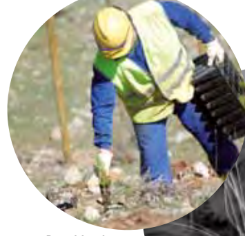
Replantando y trabajando lino.

La tradicional explotación maderera de los bosques de la Reserva ha cedido te-