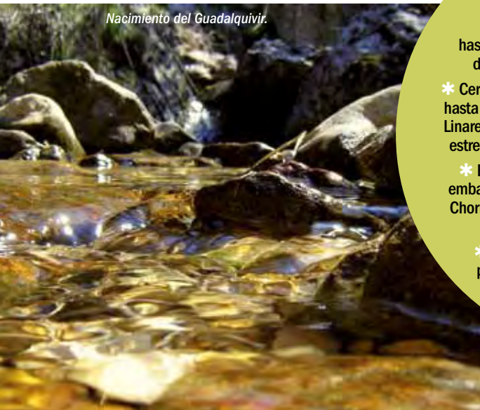
Nacimiento del Guadalquivir.

Hablar de la oferta turística del territorio, por su gran extensión y a su arraigada tradición turística, muy anterior a su declaración como espacio protegido, obligaría a una extensísima redacción, fuera del alcance de esta guía. Baste citar con que el área de influencia socioeconómica cuenta con 84 hoteles, 123 casas rurales, 58 establecimientos de apartamentos turísticos, 13 campamentos turísticos y 28 empresas de diversas actividades de turismo activo.