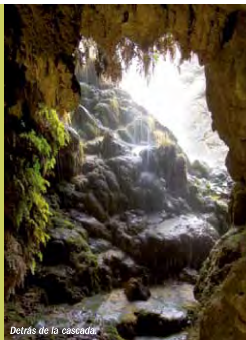
Detrás de la cascada.