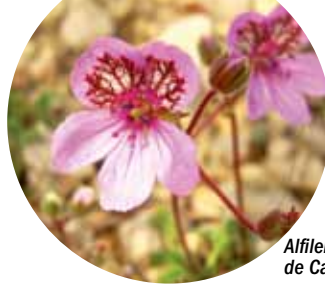
Alfilerillo de Cazorla.

El clima de este territorio es de tipo mediterráneo subhúmedo, con veranos secos y calurosos e inviernos fríos, aunque con grandes variaciones en razón de su compleja orografía. La precipitación media anual está en 850 mm, pudiendo oscilar entre los 500 mm en las zonas bajas y los 1.600-2.000 mm en las zonas altas, gran parte en forma de nieve.