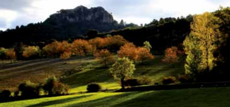
Atardecer en la Reserva.